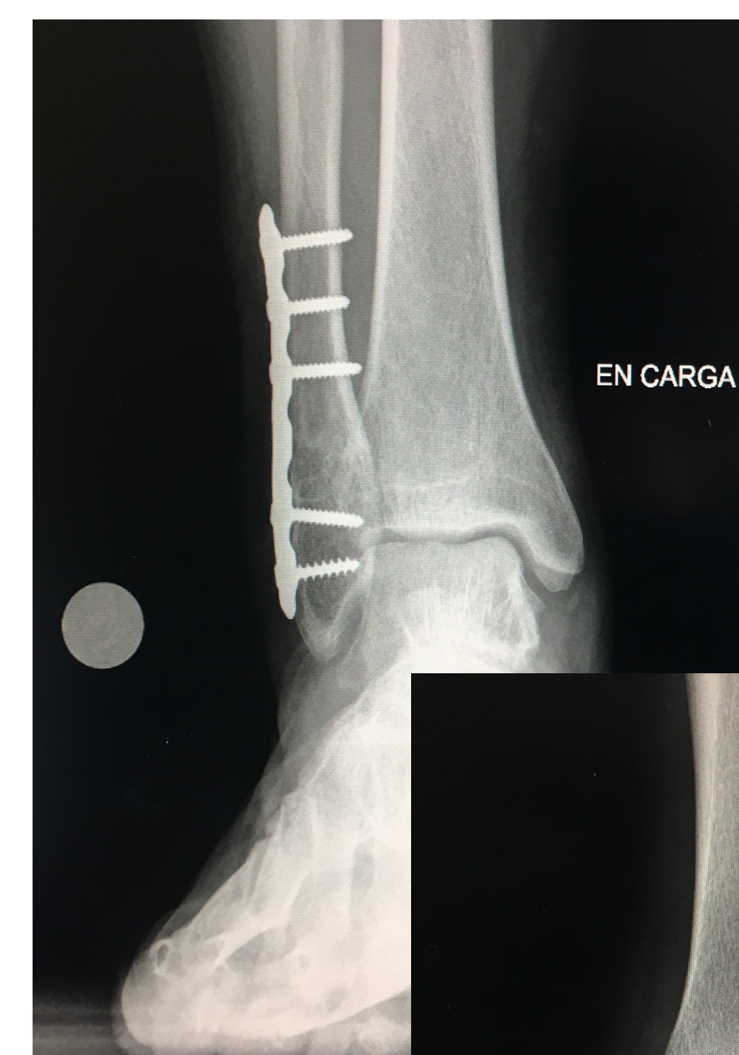
9 meses post Qx